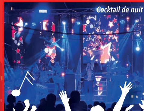
Cocktail de nuit