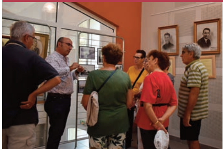
Plus de 90 personnes ont participé à cette matinée