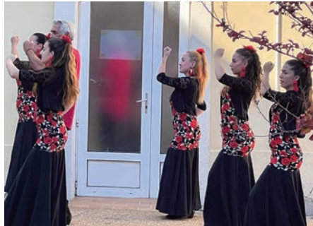
Pour clôturer la kermesse, des danseuses sévillanes ont enchanté le public

La direction a remercié l'équipe qui s'est mobilisée pour la réussite de cet après-midi récréatif et les généreux donateurs pour les lots offerts pour la tombola.