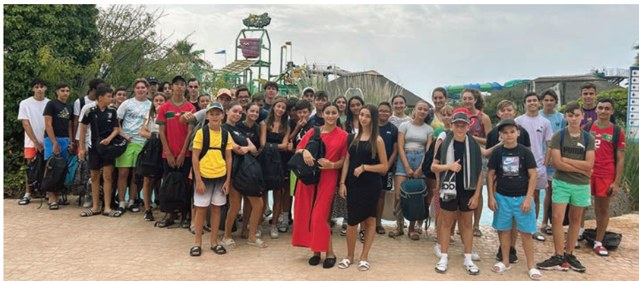
Le 16 août, 30 ados ont bénéficié de la sortie Aqualand au Cap d'Agde