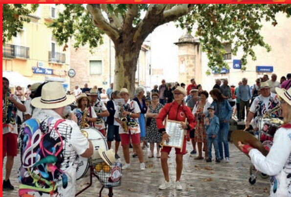
La peña « Sulfate de cuivres » nous a enchanté en attendant la remise des Médailles de la Ville