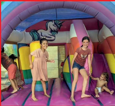
Tous les jours, Place de la République, des animations gratuites, dédiées aux enfants, ont complété la panoplie des festivités