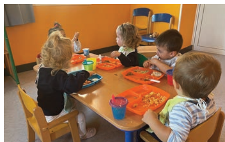
À travers ce moment de repas et grâce au plateau, nous présentons à l'enfant une assiette colorée, des textures différentes, des goûts, des odeurs...

Il utilise ainsi tous ses sens pour un apprentissage vers une alimentation équilibrée.