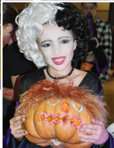
...attribuant des récompenses à chacun des heureux élus