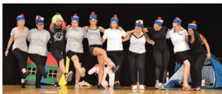
Le spectacle, tant attendu, a clôturé ces vacances d'été

Pour août 2023, c'est au total une participation de la Mairie qui s'élève à 3 528,00 €.