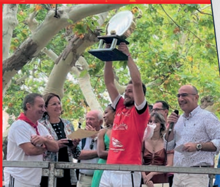
Florian Amet, champion du monde de tambourin