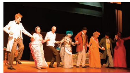
Merci aux comédiens de la compagnie qui ont joué avec brio, devant un public ravi

« Pour cacher un début de liaison avec une de ses clientes, le docteur Moulineaux se lance dans une cascade de mensonges, pirouettes et dissimulations face à sa femme, sa belle-mère, le mari de sa maîtresse, l'amante de celui-ci qui fut jadis la sienne. À force de rebondissements tout se termine à la satisfaction générale et chacun retrouve sa chacune ».