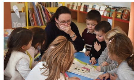
La crèche et les classes de maternelle sont accueillies dans ce lieu convivial, ouvert à tous