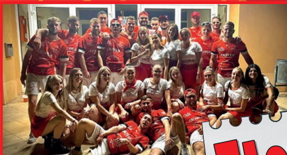
Los « Locas » et Los « Locos » prêts pour la fête