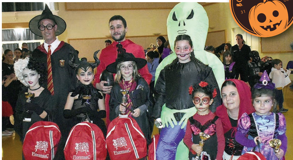
Le jury a choisi les six déguisements les plus créatifs, ainsi que la citrouille décorée la plus effrayante...

Une joyeuse frénésie s'est emparée de nos jeunes florensacois lors de la « Boum spéciale Halloween » organisée par la Municipalité.