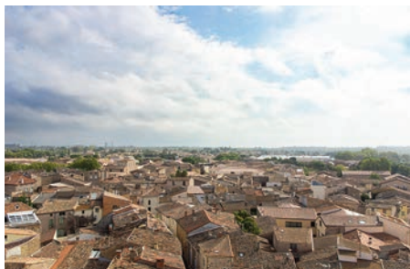
Vue de Florensac du haut du clocher de l'église

Dans le cadre de la journée européenne du patrimoine du 16 septembre, la Municipalité a organisé deux visites gratuites ouvertes à tous :