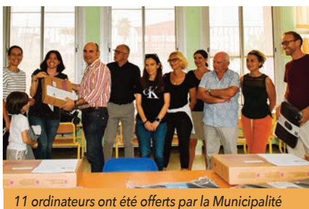
11 ordinateurs ont été offerts par la Municipalité

11 ordinateurs, qui viennent compléter le dispositif informatique numérique de l'école élémentaire, ont été offerts par la Municipalité. Un par classe, plus un pour le bureau du directeur. Un atout de plus pour la scolarité des petits Florensacois, qui, avec la formation au numérique, auront toutes les chances pour leur avenir.