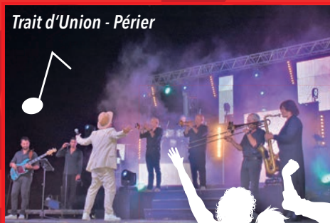
Trait d'Union - Périer