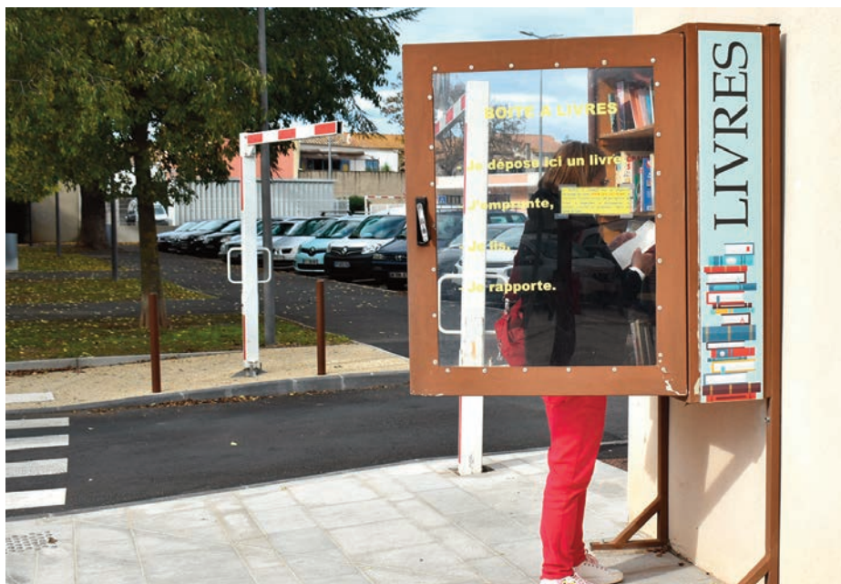
La boîte à livres est située contre le mur de la Mairie, côté police municipale. Le contenu est à la vue de tous, adultes et enfants, et ne doit pas choquer un jeune public

Dans le cadre de sa politique d'accès à la culture pour tous, Florensac a mis en place une boîte à livres qui rencontre depuis des années, toujours autant de succès. Elle est destinée à accueillir les livres que les habitants souhaitent partager.