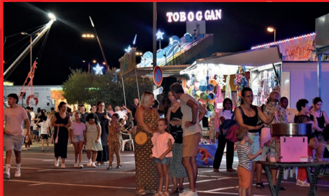
Tous les soirs, les manèges de la fête foraine avec de nouvelles attractions ont fait le bonheur de tous