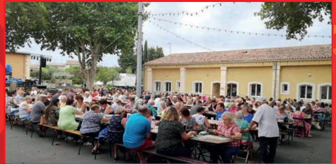
Les deux lotos organisés par les Gazelles et le Secours populaire ont connu un franc succès