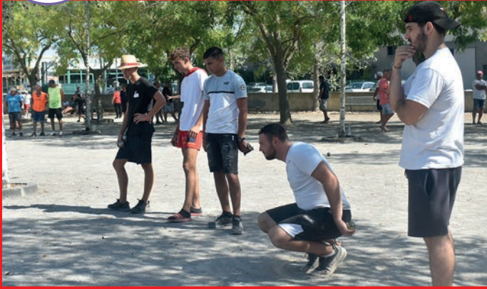
Au boulodrome, les deux clubs de pétanque ont assuré les concours de triplette