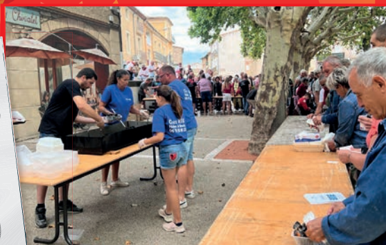
Mouclade offerte et financée par la Municipalité

Une foule en liesse, attirée par un « plateau » d'orchestres calibré à la perfection a profité pleinement de la fête locale. Merci aux associations, aux services techniques de la Mairie, de l'Agglo, et du Département ainsi qu'aux élus investis pour la réussite de cet événement !