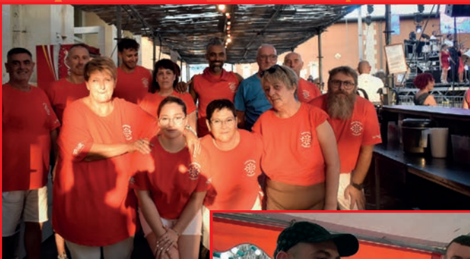
Pendant toute la fête, le Comité des fêtes a assuré la buvette et la restauration préparée par notre traiteur Loïc