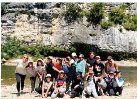
Voyage en Lozère du mois d'août